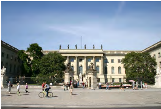
Universidade Humboldt de Berlim

No passado mês de julho foram assinadas as renovações, por mais três anos, dos Protocolos entre o Camões, I.P. e as Universidades Humboldt de Berlim e Técnica de Aachen. Em Berlim, o protocolo prevê para promoção dos estudos de língua portuguesa, através da colocação de um Leitor, considerando o interesse comum em estabelecer programas de cooperação para apoio à formação graduada e pós-graduada em estudos portugueses. Em Aachen estabelece as condições para alargar a oferta dos estudos relativos à língua portuguesa e culturas de expressão portuguesa mediante o apoio à contratação de um docente.